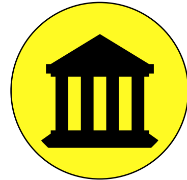
Einsatz in der Politik